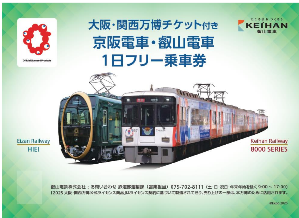
大阪・関西万博チケット付き「京阪電車・叡山電車1日フリー乗車券」台紙