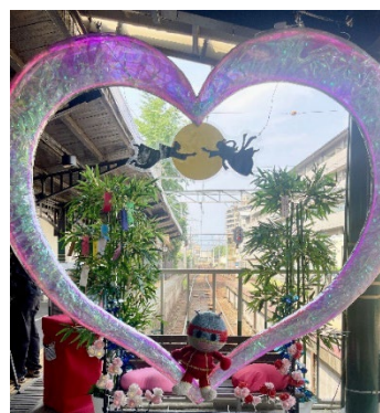
「LOVEなベンチ！」七夕装飾